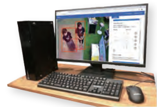
自動物体検知システム 「Trimmy」