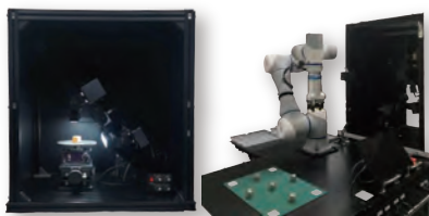
半自動検査装置 「IKZ-01」 自動検査装置 「IKZ-02」